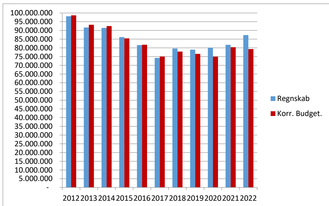
Figur 1.2 Budget- og forbrugsudvikling for Børnemyndighedsområdet fra 2012 til 2022 (nettoudgifter)